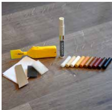
Hartwachs-Reparaturset Artikel-Nr. 1101060150

Für die Reparatur von kleinen Schäden in Bodenoberflächen (z.B. Kratzer, Druckstellen, kleine Löcher).