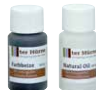
Reparatur-Set Artikel-Nr. für ausgewählte OF individuell

Zur Anwendung ist die ausführliche Anleitung auf der Produktverpackung zu beachten.