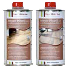
Intensiv-Pflegeöl farblos/weiß Artikel-Nr. 1101060086/ 1101060087

Hinweis: Bei außergewöhnlicher Abnutzung sollte die Oberfläche vorzugsweise durch einen qualifizierten Parkettverleger erneuert werden.