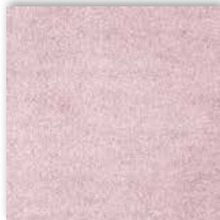
16 4m + 5m