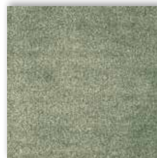
24 4m + 5m