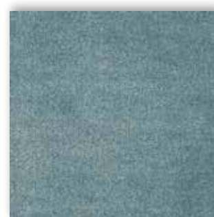
74 4m + 5m