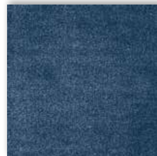
78 4m + 5m