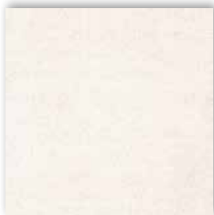
03 4m + 5m