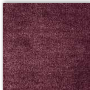
19 4m + 5m