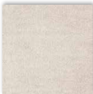
39 4m + 5m