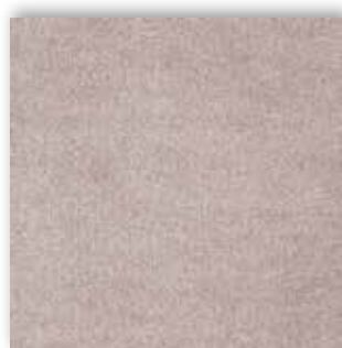
45 4m + 5m