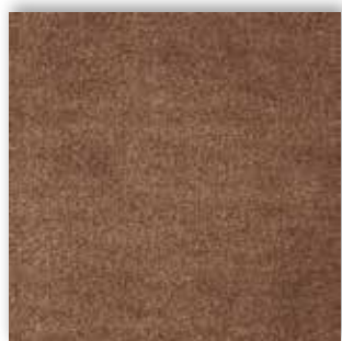
44 4m + 5m