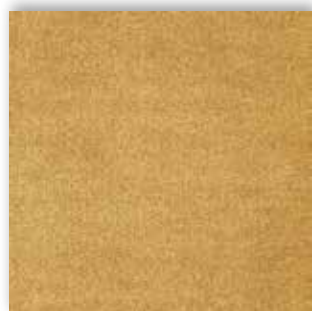
54 4m + 5m