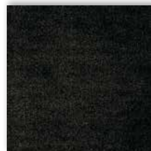
99 4m + 5m

La société Associated Weavers se réserve le droit de modifier les caractéristiques de ce produit tout en conservant les mêmes qualités techniques. Il est fortement conseillé d'utiliser les coloris moyens et foncés pour les pièces à grand trafic.