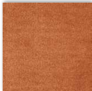
84 4m + 5m