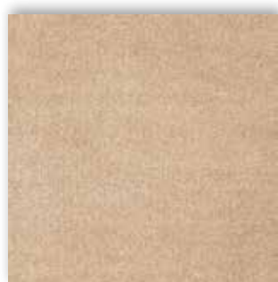
36 4m + 5m