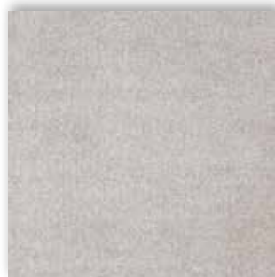
95 4m + 5m