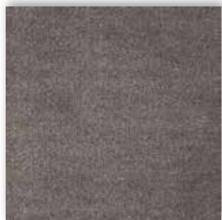
97 4m + 5m