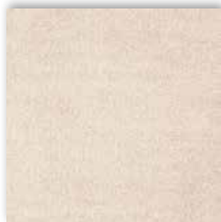
33 4m + 5m